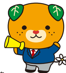
愛媛県 イメージアップ キャラクター みきやん

※携帯メールアドレスはご登録いただけません。 ※ご登録いただいた情報は適正に管理し、本事業のみに利用いたします。