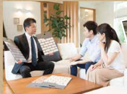
< 安芸府中町・建設業・従業員60名 >

取組前 顧客との打合せは営業・設計など複数名で対応 取組施策 業務の標準化(リフォームプランのパッケージ化) 取組後 ◎1人体制で顧客との打合せが可能に ◎担当・顧客双方の時間短縮 +顧客の多様なニーズに対応