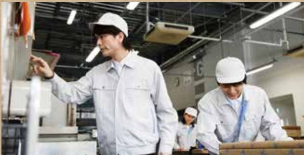
< 広島市・製造業・従業員150名 >

取組前 1人一台の機械・作業工程に専従 取組施策 多能工(マルチスキル)化の推進 取組後 ◎1人が複数の機械・作業を担当し、スキルアップ ◎生産性を落とさずに、一人当たり平均で、 残業 約5時間/月削減、有給取得率約12%UP